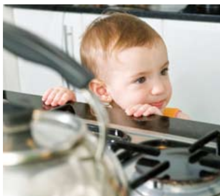
Kinder nicht unbeaufsichtigt in die Nähe des Herdes lassen!