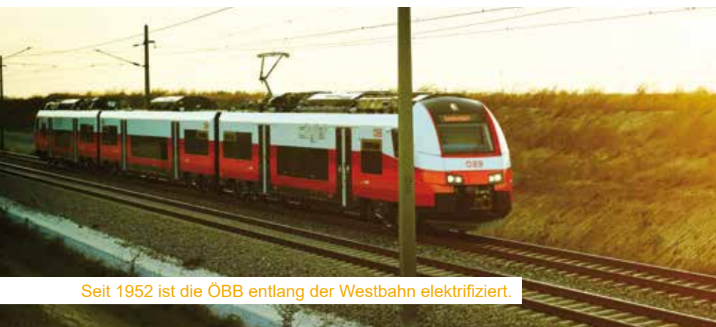
Seit 1952 ist die ÖBB entlang der Westbahn elektrifiziert.

November 1978 entschieden sich 50,47 Prozent der Österreicherinnen und Österreicher gegen die Inbetriebnahme des inzwischen fast fertiggestellten ersten Reaktors in Zwentendorf und gegen den Bau weiterer Anlagen. Heute erzeugt Österreich keinen Strom aus Atomkraft und gilt mit einem Schwerpunkt auf Erneuerbare Energien wie Wasser- und Windkraft als europaweites Vorbild. Österreich hat durch seine geografische Lage das Glück, die Stromversorgung vor allem auf die erneuerbare Ressource Wasserkraft abstützen zu können. In den letzten Jahren sind auch Wind- und Sonnenkraftwerke hinzugekommen.